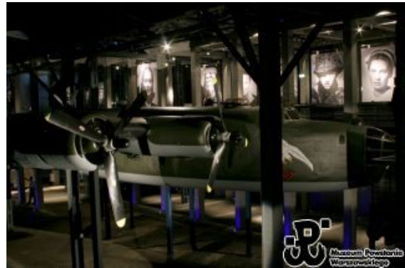
Replika samolotu Liberator B-24J